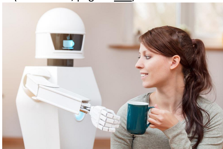
Figura 4: A Mosca sono apparse le prime caffetterie che usano l'intelligenza artificiale