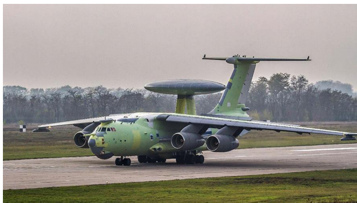
Figura 3: Aereo “segreto” che verrà presentato durante la parata del 9 maggio