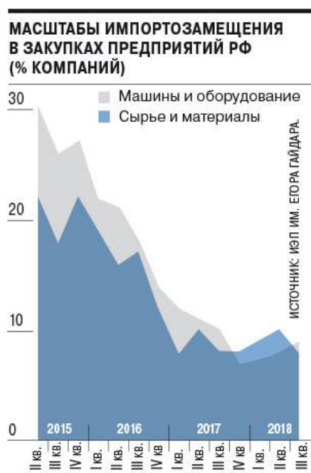
Figura 2: Proporzione delle sostituzioni delle importazioni negli appalti delle imprese della Federazione russa (% delle società)