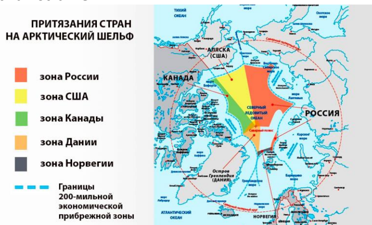
Figura 1: Schema dei Paesi che rivendicano i territori dell’Artico

I convenuti al Forum – circa 3 mila persone da 50 Paesi del Mondo, rappresentanti di 300 compagnie russe e di circa 50 società straniere, scienziati ed esperti – hanno discusso “l’oceano di possibilita” offerto dalle zone e dai mari dell’Artico e anche un “mare di problemi” che l’Artico mette di fronte all’umanità e, prima di tutto, ai Paesi vicini. Nel suo intervento il Presidente Putin ha messo in evidenza che i grandi progetti si realizzano bene nelle regioni e nelle città dell’Artico. Ha ribadito che “le varie sanzioni non fermeranno l’esplorazione della Regione” e ha rivelato che le autorità russe intendono approvare una nuova strategia di sviluppo delle regioni nazionali