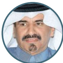
Мохаммед БИН ТАУАР АЛЬ-КАВАРИ Вице-Президент Катарской Торгово-промышленной Палаты