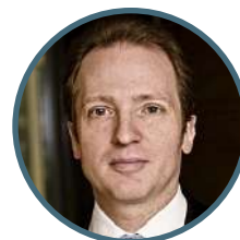
ВОТЦЕЛЬ Джонатан Глава Глобального Института «McKinsey»