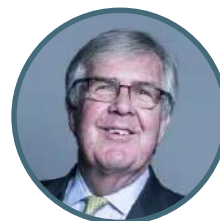
Лорд УЗВЕРЛИ Действующий член Палаты Лордов Парламента Великобритании