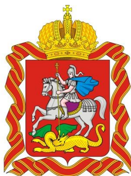
Figura 3: Stemma della regione di Mosca.

Sono significativi e considerevoli i principali obiettivi per il 2019 e per i prossimi 5 anni, a gennaio resi noti nel messaggio del governatore Andrei Vorobjov alla popolazione della Regione.