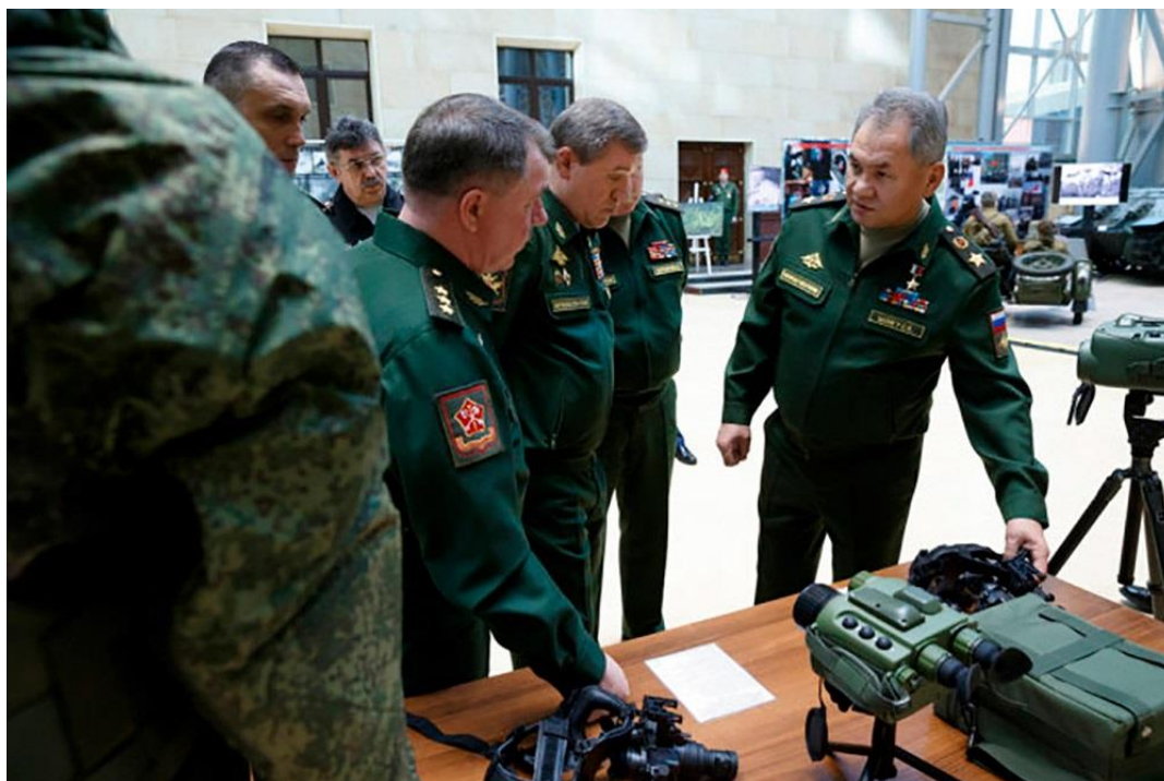
Figura 1: Il ministro della difesa Serghej Shoigu ha spiegato come e con cosa saranno potenziate le truppe a sud, ovest ed est della Russia.